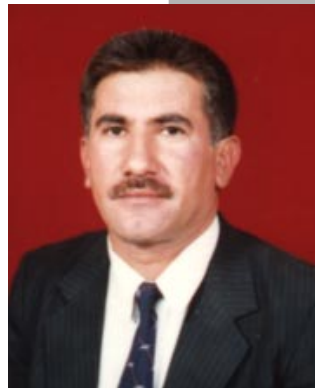
سه عيدين سلؤ

ل سالا ۱۹۸۵ ئى وژبو جارا ئىيكي وهكو نقيسه رهكي كورد يى ئيزدى مه فه كولينهك لدور په يفا لالشي ل روظنما (هاوكارى) ژماره (۴۶۷) وه شانديه، ول سالا ۱۹۸۶ ئى فه كولينهكا دى ل بابته ديروكا لالشي ل كوشارا (روشنبيرى نوئ) ژماره (۱۰۹) به لاشكريبه ومه دلكره ب ئاوايهكى زانستى ديروكا لالشي بدن نقيساندن، وفايه پشتى بيست سالا شونده جارهكا دى دخوازن ل بابته جيئ لالشي دديروكا كوردستاني ده بدن زانين ههر چهنده ب دههان نقيسه رتين كورد ويياني ل بابته جى وناث وديروك وناقايين لالشي نقيساندينه. لى بنگومانه چهندين بازنين بهرزه ژ ديروكا لالشي شونده مانه وپيدشى فه كولينيه.